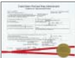
「日本向けのバイオフィリーズ」は米国FDAで承認された製品です。

バイオフィリーズは…●ナショナル・フットボールリーグ選手●オリンピック選手●オリンピック公式トレーナー●大リーガー●プロ野球●プロ・アマサッカー選手●プロ・アマバスケットボール選手●ラグビー選手●陸上選手●バレーボール選手●プロ・アマゴルファー●プロ・アマボクサー●ウィンタースポーツ選手●自転車競技選手●体操選手●プロ・アマテニスプレーヤー●各種格闘競技●プロ・アマ相撲●プロ・アマレスリング●水泳●レーサー●競馬騎手●少年野球●少年サッカー等、多くのスポーツ関係者にご愛用頂いております。